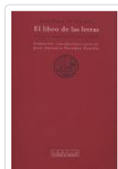
LIBRO DE LAS LETRAS, EL AL FARABI