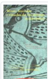
MITOS, LEYENDAS Y RITUALES DE LOS SEMITAS OCCIDENTALES DEL OLMO LETE