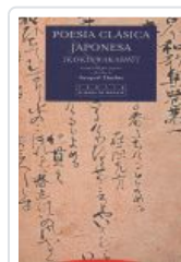
POESIA CLASICA JAPONESA DUTHIE, TORQUIL