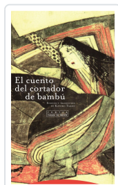
CUENTO DEL CORTADOR DE BAMBU TAKAGI