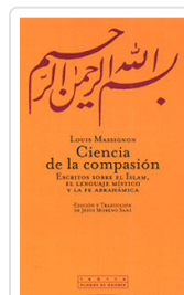
CIENCIA DE LA COMPASION, LA MASSIGNON, LOUIS