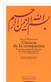
CIENCIA DE LA COMPASION, LA MASSIGNON, LOUIS