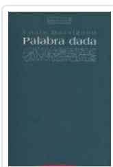
PALABRA DADA MASSIGNON, L