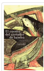
CUENTO DEL CORTADOR DE BAMBU TAKAGI