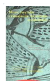
MITOS, LEYENDAS Y RITUALES DE LOS SEMITAS OCCIDENTALES DEL OLMO LETE