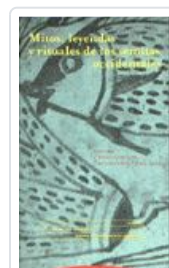
MITOS, LEYENDAS Y RITUALES DE LOS SEMITAS OCCIDENTALES DEL OLMO LETE