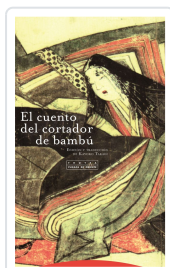
CUENTO DEL CORTADOR DE BAMBU TAKAGI