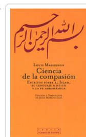
CIENCIA DE LA COMPASION, LA MASSIGNON, LOUIS