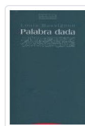
PALABRA DADA MASSIGNON, L