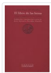
LIBRO DE LAS LETRAS, EL AL FARABI