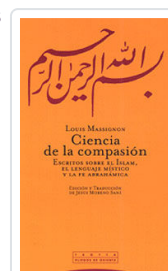
CIENCIA DE LA COMPASION, LA MASSIGNON, LOUIS