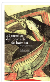
CUENTO DEL CORTADOR DE BAMBU TAKAGI