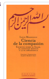
CIENCIA DE LA COMPASION, LA MASSIGNON, LOUIS