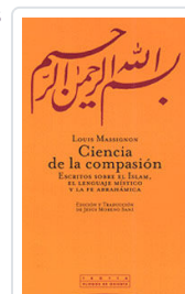
CIENCIA DE LA COMPASION, LA MASSIGNON, LOUIS