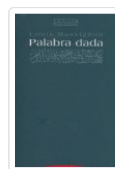
PALABRA DADA MASSIGNÓN, L