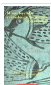
MITOS, LEYENDAS Y RITUALES DE LOS SEMITAS OCCIDENTALES DEL OLMO LETE