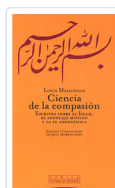
CIENCIA DE LA COMPASION, LA MASSIGNON, LOUIS