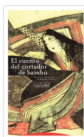
CUENTO DEL CORTADOR DE BAMBU TAKAGI