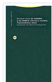
REALIDAD Y SU SOMBRA LEVINAS