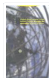
CRACK DEL AÑO OCHO, EL CAPELLA, JOSE RAMON