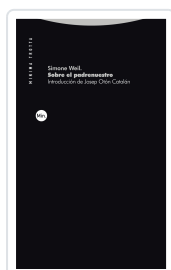
Sobre el padrenuestro Simone Weil