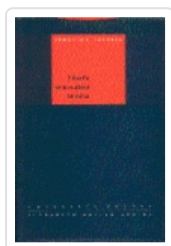
Filosofía de la realidad histórica Ellacuría, Ignacio