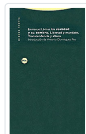
REALIDAD Y SU SOMBRA LEVINAS