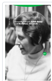
Judith Shklar y el liberalismo del miedo Vallespín Oña, Fernando