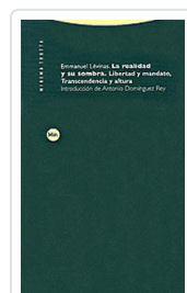
REALIDAD Y SU SOMBRA LEVINAS