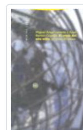
CRACK DEL AÑO OCHO, EL CAPELLA, JOSE RAMON