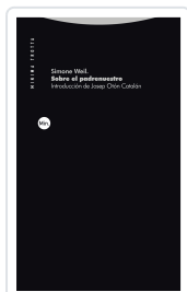
Sobre el padrenuestro Simone Weil