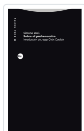
Sobre el padrenuestro Simone Weil