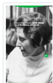
Judith Shklar y el liberalismo del miedo Vallespín Oña, Fernando