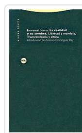
REALIDAD Y SU SOMBRA LEVINAS