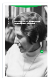
Judith Shklar y el liberalismo del miedo Vallespín Oña, Fernando