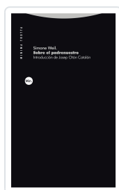
Sobre el padrenuestro Simone Weil