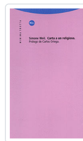
CARTA A UN RELIGIOSO. SIMONE WEIL