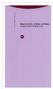
ORDEN Y EL TIEMPO, EL SACRISTÁN, MANUEL