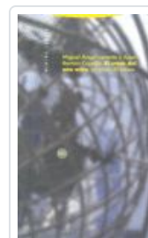
CRACK DEL AÑO OCHO, EL CAPELLA, JOSE RAMON