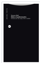
Sobre el padrenuestro Simone Weil