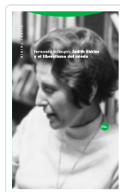
Judith Shklar y el liberalismo del miedo Vallespín Oña, Fernando