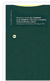
REALIDAD Y SU SOMBRA LEVINAS