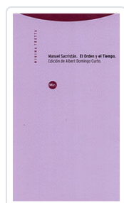
ORDEN Y EL TIEMPO, EL SACRISTÁN, MANUEL