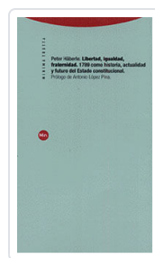
LIBERTAD, IGUALDAD, FRATERNIDAD HABERLE