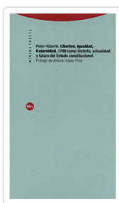
LIBERTAD, IGUALDAD, FRATERNIDAD HABERLE