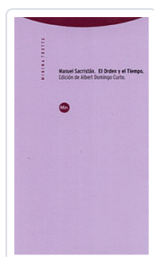
ORDEN Y EL TIEMPO, EL SACRISTÁN, MANUEL