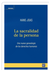
SACRALIDAD DE LA PERSONA, LA HANS JOAS