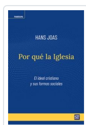
POR QUE LA IGLESIA JOAS, HANS