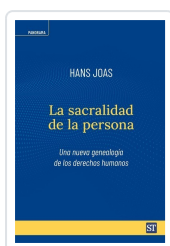
SACRALIDAD DE LA PERSONA, LA HANS JOAS