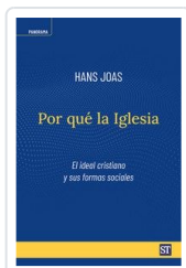
POR QUE LA IGLESIA JOAS, HANS