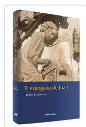
EVANGELIO DE JUAN, EL MOLONEY, F.