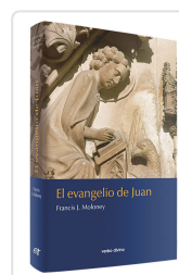
EVANGELIO DE JUAN, EL MOLONEY, F.