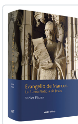
EVANGELIO DE MARCOS (EVD) PIKAZA IBARRONDO, XABIER