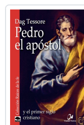
PEDRO EL APOSTOL TESSORE, DAG