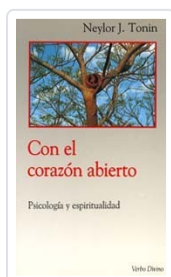
Con el corazón abierto n° 2 Tonin, Neylor J.