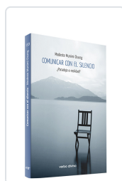
Comunicar con el silencio Munimi Osung, Modeste