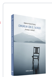
Comunicar con el silencio Munimi Osung, Modeste