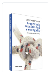
Trenzando sensibilidad y evangelio del Valle García, Carlos