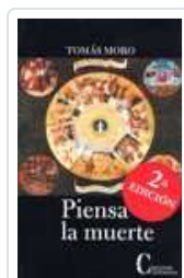
PIENSA LA MUERTE MORO, ROMAS