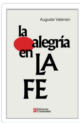
LA ALEGRÍA EN LA FE AUGUSTE VALENSIN