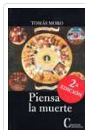
PIENSA LA MUERTE MORO, ROMAS