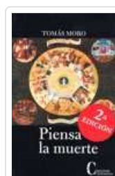
PIENSA LA MUERTE MORO, ROMAS