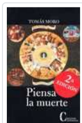
PIENSA LA MUERTE MORO, ROMAS