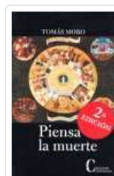
PIENSA LA MUERTE MORO, ROMAS