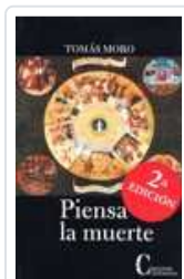
PIENSA LA MUERTE MORO, ROMAS