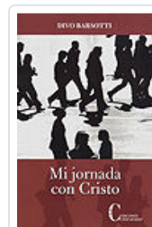
MI JORNADA CON CRISTO BARSOTTI, DIVO