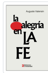
LA ALEGRÍA EN LA FE AUGUSTE VALENSIN