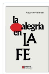
LA ALEGRÍA EN LA FE AUGUSTE VALENSIN