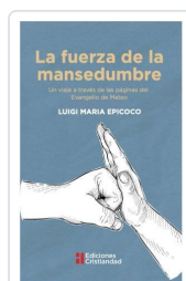
LA FUERZA DE LA MANSEDUMBRE LUIGI MARIA EPICOCO