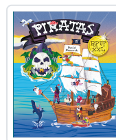
Piratas pop up XXL Hawcock, David