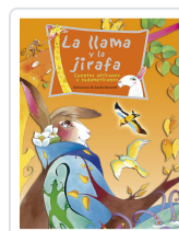
LA LLAMA Y LA JIRafa BERSANETTI, SANDRA