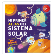
Mi primer Atlas del sistema solar AA.VV.