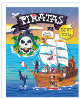
Piratas pop up XXL Hawcock, David