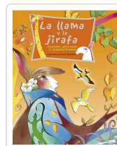
LA LLAMA Y LA JIRafa BERSANETTI, SANDRA