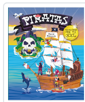
Piratas pop up XXL Hawcock, David