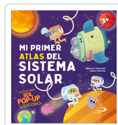
Mi primer Atlas del sistema solar AA.VV.