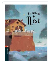
ARCA DE NOE, EL VIRGINIE ALADJIDI Y CAROLIN