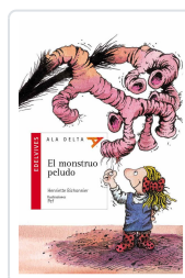
MONSTRUO PELUDO HENRIETTE BICHONNIER