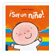
SOY UN NIÑO! LIESBET SLEGERS