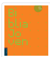
BIBLIA JOVEN VARIOS