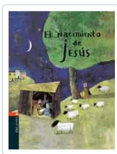
NACIMIENTO DE JESUS, EL VIRGINIE ALADJIDI Y CAROLIN