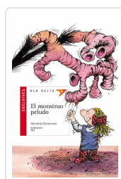
MONSTRUO PELUDO HENRIETTE BICHONNIER