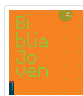
BIBLIA JOVEN VARIOS