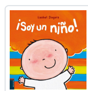
SOY UN NIÑO! LIESBET SLEGGERS