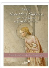
NUESTRA SEÑORA EN LA POESIA ESPAÑOLA ACTUAL CABANILLAS, JOSE JULIO