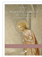
NUESTRA SEÑORA EN LA POESIA ESPAÑOLA ACTUAL CABANILLAS, JOSE JULIO