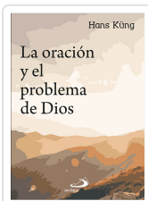
ORACION Y EL PROBLEMA DE DIOS KUNG, HANS