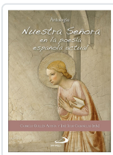
NUESTRA SEÑORA EN LA POESIA ESPAÑOLA ACTUAL CABANILLAS, JOSE JULIO