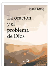
ORACION Y EL PROBLEMA DE DIOS KUNG, HANS