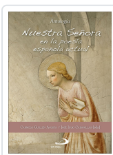
NUESTRA SEÑORA EN LA POESIA ESPAÑOLA ACTUAL CABANILLAS, JOSE JULIO