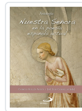
NUESTRA SEÑORA EN LA POESIA ESPAÑOLA ACTUAL CABANILLAS, JOSE JULIO