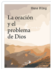
ORACION Y EL PROBLEMA DE DIOS KUNG, HANS