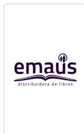
EVANGELIO 2023 (SP) EQUIPO SAN PABLO