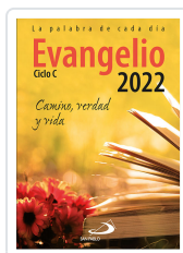
EVANGELIO 2022 (SP) EQUIPO SAN PABLO