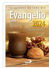
EVANGELIO 2024 (SP) SPABLO