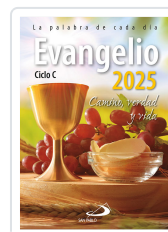
EVANGELIO 2025 (SP) AA.VV.