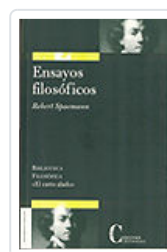
ENSAYOS FILOSOFICOS SPAEMANN