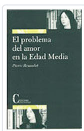
PROBLEMA DEL AMOR EN LA EDAD MEDIA, EL ROUSSELOT, PIERRE