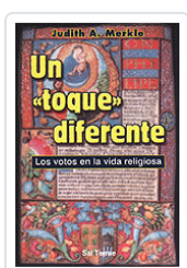
UN TOQUE DIFERENTE n° 82 MERKLE, JUDITH