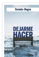
DEJARME HACER n° 183 NEGRE, FERMIN