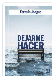
DEJARME HACER nº 183 NEGRE, FERMIN