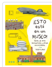
ESTO ESTÁ EN UN MUSEO! ÁLAMO, ROSA