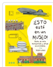
ESTO ESTÁ EN UN MUSEO! ÁLAMO, ROSA