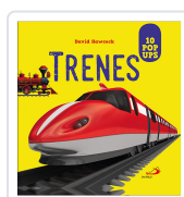
TRENES. POP UPS