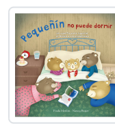
PEQUEÑIN NO PUEDE DORMIR MERLAN, PAULA