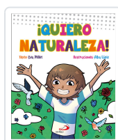
QUIERO NATURALEZA MILLET, EVA