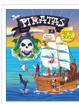
Piratas pop up XXL Hawcock, David