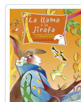
LA LLAMA Y LA JIRafa BERSANETTI, SANDRA