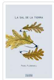
SAL DE LA TIERRA, LA (SIG) FLORENSKIJ