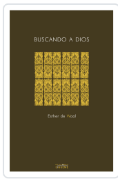
BUSCANDO A DIOS